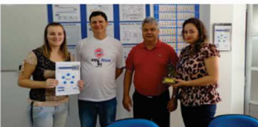
Setor: Direção Comercial e Financeira

Após um período de Treinamento e Auditorias foram divulgadas, no dia 04 de março, as notas referentes às avaliações do Programa 5S's. Também foram entregues aos setores, o Plano de Ação mostrando os pontos que necessitam de melhorias, identificados pelo comitê de avaliadores. Estes pontos estão sendo trabalhados juntamente aos responsáveis de cada setor, proporcionando assim a melhoria contínua do ambiente de trabalho.