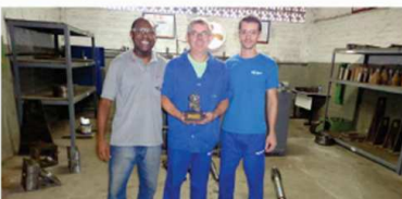
Setor: Controle de Qualidade