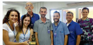
Setor: Contabilidade, Custos e PCP